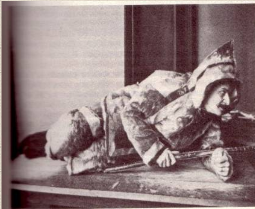
F. Boas (presso gli Eschimesi Inuit)